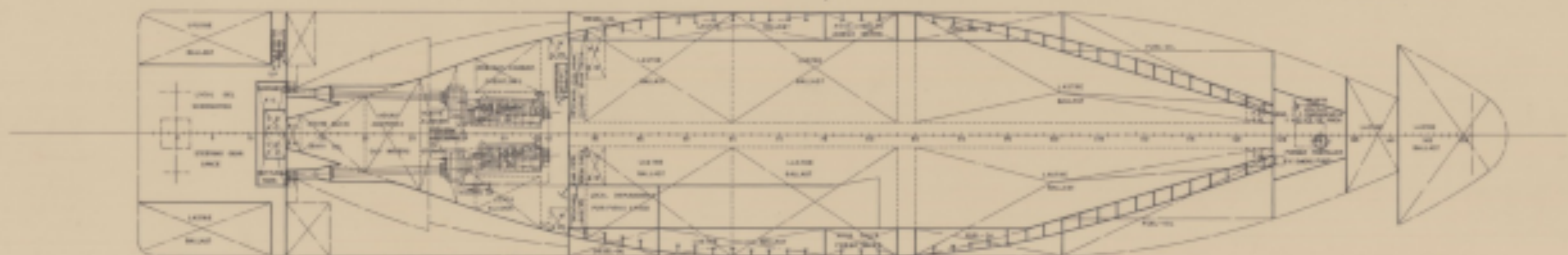
DOBLE FONDO DOUBLE BOTTOM